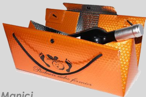
Manici in cordoncino