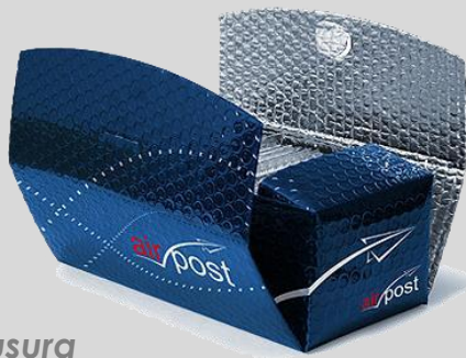
Chiusura con velcro