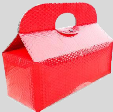
Chiusura con bottone